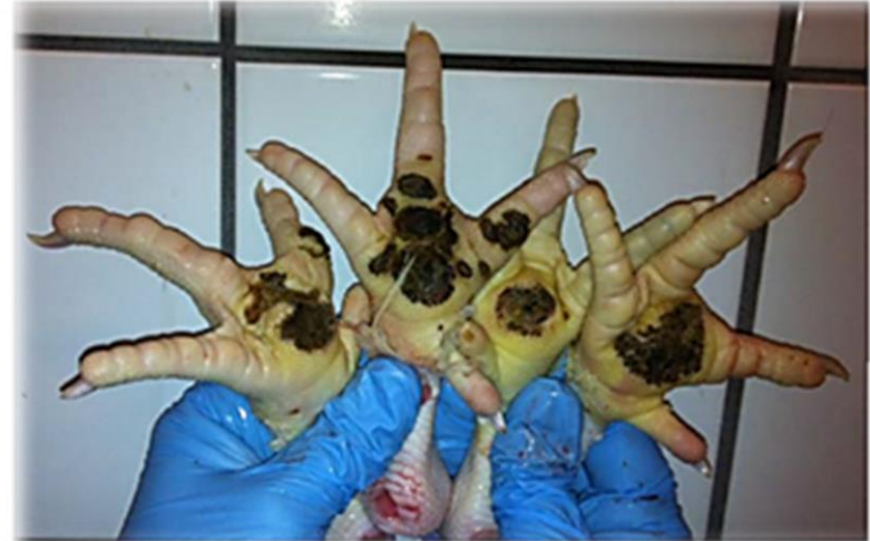
Alvarlegur dritbruni – flokkur 2

Dritbruni hefur áhrif á leyfðan hámarkspéttleika kjúklinga í eldishúsum