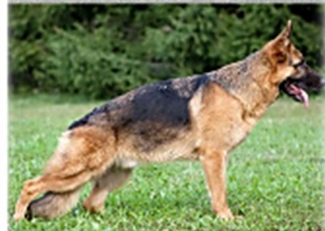
Schafer – oft vandamál í baki og mjöðmum